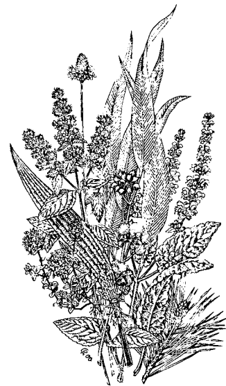
Heilpflanzen im WALA-Garten